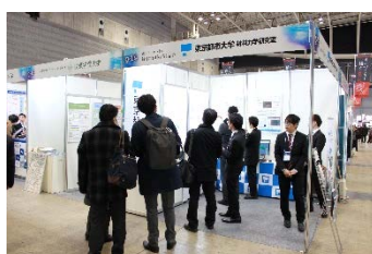
研究成果の説明を行う研究室の学生